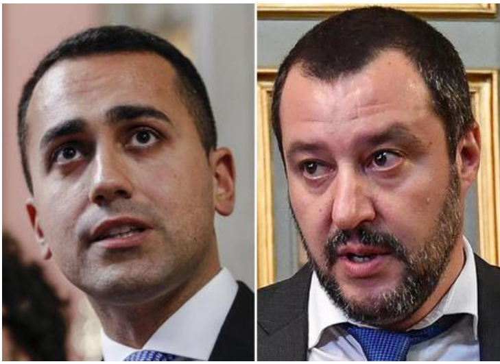
Luigi Di Maio, hoofd van M5S, en Matteo Salvini, hoofd van de League,