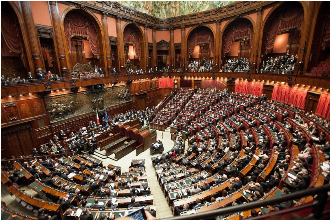
Italiaanse Kamer van Afgevaardigden

Hoewel dit wetsvoorstel op 6 augustus 2018 is opgesteld, en hoewel Claudio Borghi er al maanden over tweet, krijgen de reguliere financiële media nu pas nu, zes maanden later, lucht van dit wetsvoorstel. Zo heeft Reuters pas nu een artikel gepubliceerd, gedateerd 11 februari 2019, getiteld "League drafts terms for possible sale of Italy's gold reserves".